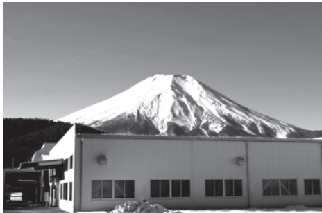
『富士山の秘水』製造工場