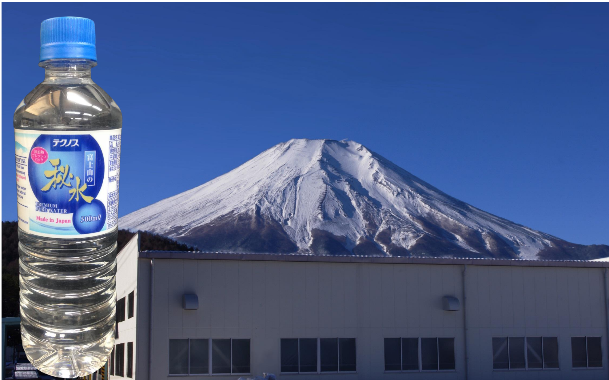
『富士山の秘水』 製造工場