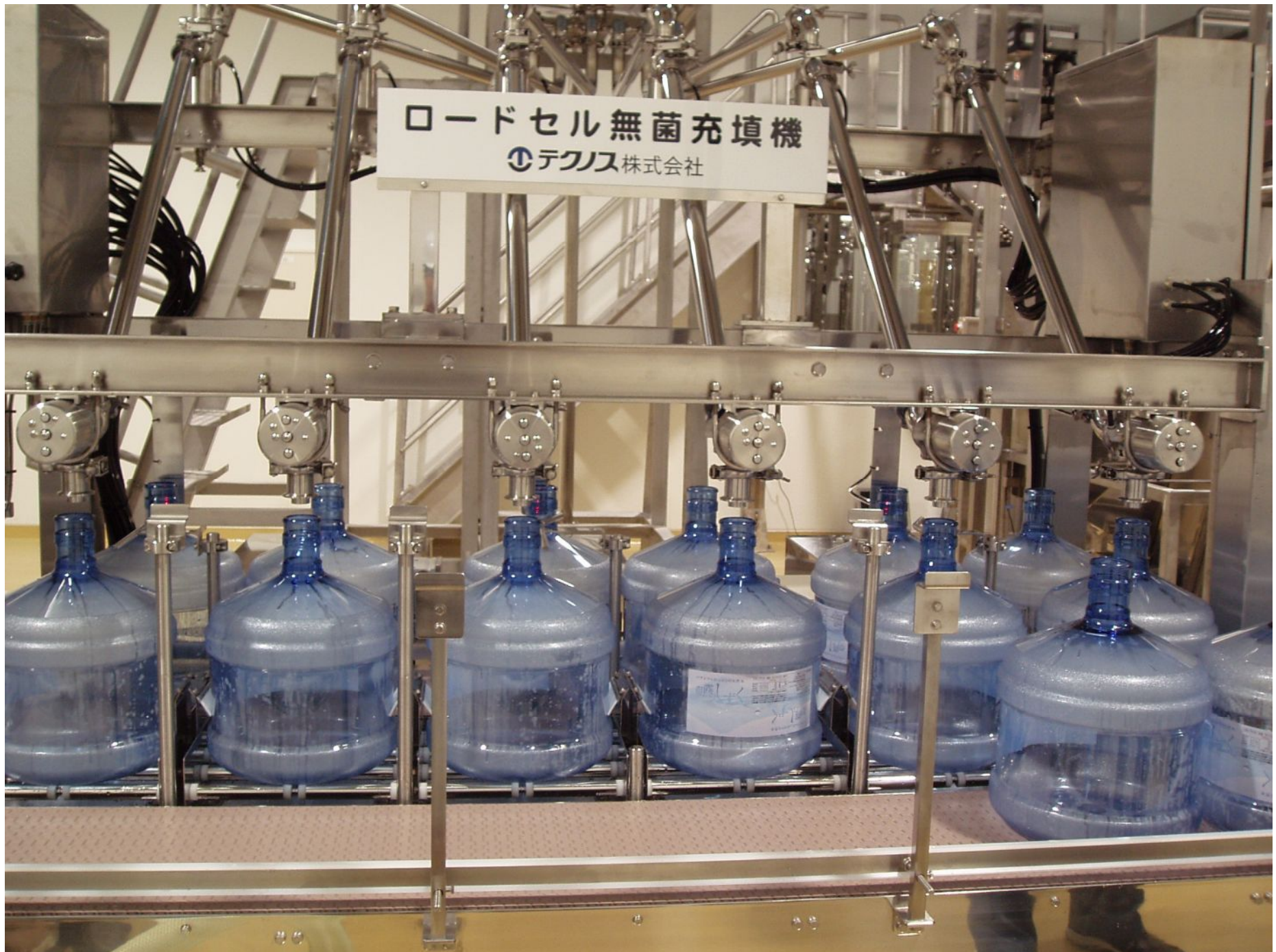
ガロンボトル無菌充填機／打栓機（クリーンブースクラス 100 付） 能力 1,000 本／時 at 3 ガロン