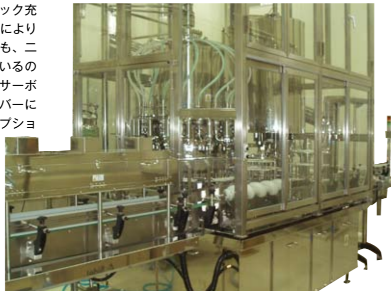
クリーンルーム(クラス1000)内の壘口紫外線殺菌装置と、クリーンブース(クラス100)に組み込まれた無菌充填機/サーボキャッパー

本機は非加熱無菌充填用に開発されたアセプティック充填機で、電磁流量計とダイヤフラムバルブの組合せによりサニタリー性に優れた仕様になっています。しかも、二段コントロール式ダイヤフラムバルブを採用しているので高速充填性にも優れています。キャッパーは、サーボモーターを使用したリングコーン式トルクドライバーによりキャップの締めトルクをデジタル表示し、オプションでプリンターによる記録紙出力ができます。充填機/キャッパーは、クラス100のクリーンブースに一体方式で組み込んでいます。